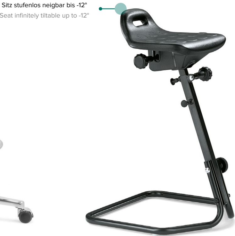
Stehhilfe mit Gestell Standing aid with frame