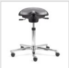
Ergo-Hocker Ergo-stool IS 19820: 54-79 cm