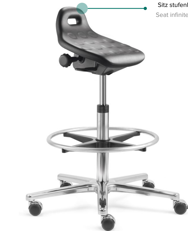
Stehhilfe mit Fußring Standing aid with foot ring