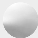
Kunstleder Imitation leather