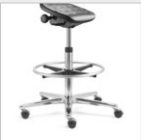
Stehhilfe mit Fußring Standing aid with foot ring Bsp./e.g.: IS 19678: 55-80 cm