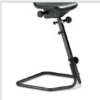
Stehhilfe mit Gestell Standing aid with frame Bsp./e.g.: IS 19660: 62-79 cm